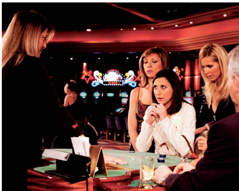
FICCION • Imagen de la serie de ficción "Aquí no hay quien viva" rodada el 31 de marzo de 2006 en las instalaciones del Casino Gran Madrid.